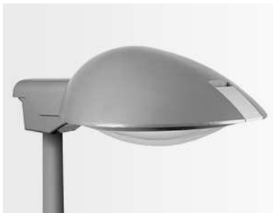
PCN / Pechina

TNA | MDA | ADA | MDL sloupec | PCN / Pechina | PCN / Pechina Columna | JNR / mladší | JNR C / mladší sloupec | Denver Max | Denver pachole | Denver zeď | Denver Polák | Auri | Torxa | Plamen | ML 250 / měsíční svit | MLS 250 | SM / Silvermoon | DQR | DQF | AG | S 250 | SC sloupec | L 450 Brazo | L 700 Brazo | SC 250 | SCG Brazo | SCG sloupec | SCP Brazo | SCP sloupec | Wallpackette III | Vícenásobný sloupec | Městský sloupec | Nový městský sloupec | Mantis sloupec | Miramar sloupec | Bulvár sloupec | Vilanova 2 sloupec | Občanský sloupec | Jiskra G | Xaloc sloupec | Garbi sloupec | V přímé linii sloupec | Mistral sloupec